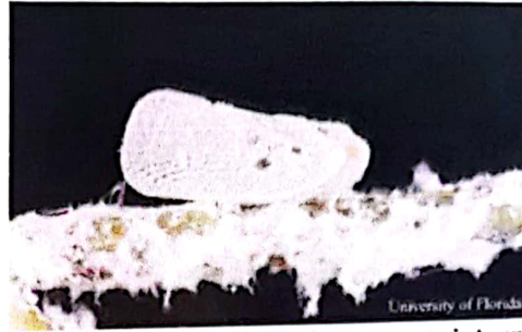
Fig. 1. Adult Metcalfa pruinosa