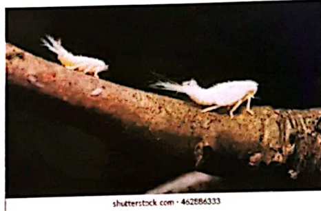
Fig. 2. Nimfe Metcalfa pruinosa , sursa internet