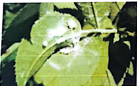
Fig. 4. Nimfe pe Rosa cannina

Agrointel - Cicada Metcalfa pruinosa: Soluții de combatere fără chimicale sau cu insecticide (4 iulie 2019)